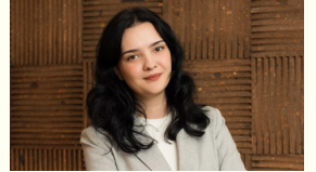
BESTE TURAN AVUKAT

Patent ve Faydalı Modeller Fikri Mülkiyet İlaç, Tıbbi Cihaz ve Sağlık Hukuku